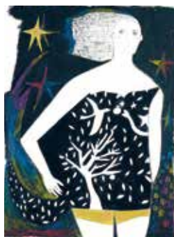
夜風は身体を駆け抜ける