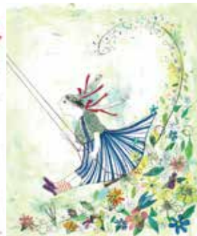
つむじ風をおこせ