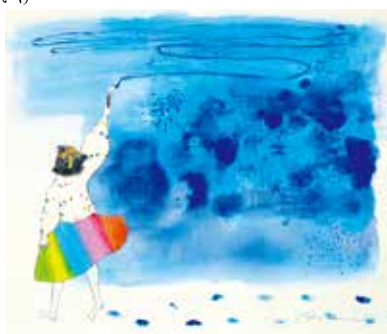
あの空の色がほしい

2022年7月、トヨタ「MIRAI」(長野トヨタ)のラッピングカーの為に作品を提供。BMW ジャパンのエコカー「i3」のラッピングや、JTA(日本トランスオーシャン航空)のイリオモテヤマメコ・デカール機、洋菓子舗ウエストなど企業とのコラボレーションも多数手がけている。東日本大震災以降は、被災地の子どもたちに絵本・画材を届ける活動や、福島県相馬市に絵本専門の文庫「にじ文庫」を設立。文部科学省復興教育支援事業のコーディネーターをつとめるなど、全国の子どもたちとアートをつなぐ活動を行なっている。被災地でおこなった子どもたちへの活動は、震災後10年の特番として、NHK BS1スペシャル「10年目の約束～福島の子どもたちが描いた”未来”～」で紹介された。また、これまでのすべての活動に対し雑誌「pen」クリエイターアワード2021「日本と世界を変えていく、2021年最も輝いた7組」で審査員特別賞を受賞。2023年、絵本「ハナはへびがすき」(福音館書店)が「第14回ようちえん絵本大賞」を受賞。2024年刊行の『あの空の色がほしい』(河出書房新社)が、全国学校図書館協議会選定図書に選ばれる。