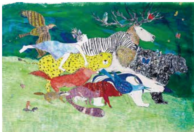
クンパルシートー世界の果てー