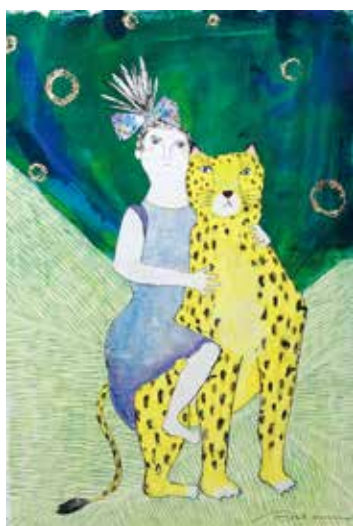
ラ・クンパルシート