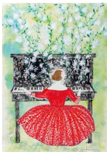
小手種の咲くピアノ曲