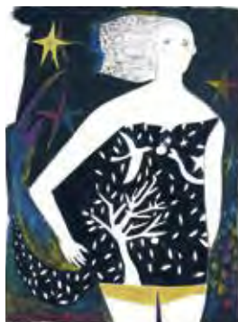
夜風は身体を駆け抜ける