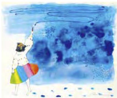
あの空の色がほしい

2022年7月、トヨタ「MIRAI」(長野トヨタ)のラッピングカーの為に作品を提供。 BMW ジャパンのエコカー「i3」のラッピングや、JTA(日本トランスオーシャン航空)のイ リオモチヤマネコ・デカル機、洋菓子舗ウエストなど企業とのコラボレーションも多数 手がけている。東日本大震災以降は、被災地の子どもたちへに絵本・画材を届ける活動 や、福島県相馬市に絵本専門の文庫「にじ文庫」を設立。文部科学省復興教育支援 事業のコーディネーターをつとめるなど、全国の子どもたちとアートをつなぐ活動を行な っている。被災地でおこなった子どもたちへの活動は、震災後10年の特番として、 NHK BS1スペシャル「10年目の約束～福島の子どもたちが描いた“未来”～」で紹介 された。また、これまでのすべての活動に対し雑誌「pen」クリエイターアワード2021「日 本と世界を変えていく、2021年最も輝いた7組」で審査員特別賞を受賞。2023年、絵 本「ハナはへびがすき」(福音館書店)が「第14回ようちん絵本大賞」を受賞。